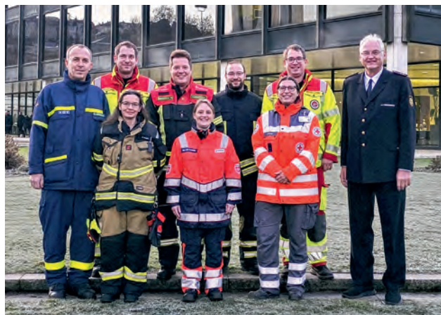
Vertreter der Hilfsorganisationen bei der Abstimmung des Landeskatastrophenschutzgesetzes im baden-württembergischen Landtag.

Erstmals werden auch Personen berücksichtigt, die im Ernstfall spontan Hilfe leisten. Die finanzielle Förderung des Ehrenamtes übernimmt künftig das Land. Das entlastet Kommunen und vereinfacht Verwaltungsabläufe.