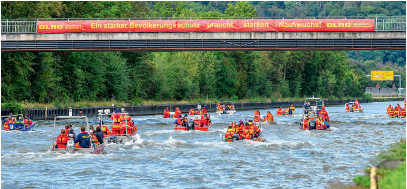
Statement beim ersten JET-Wettkampf 2024.