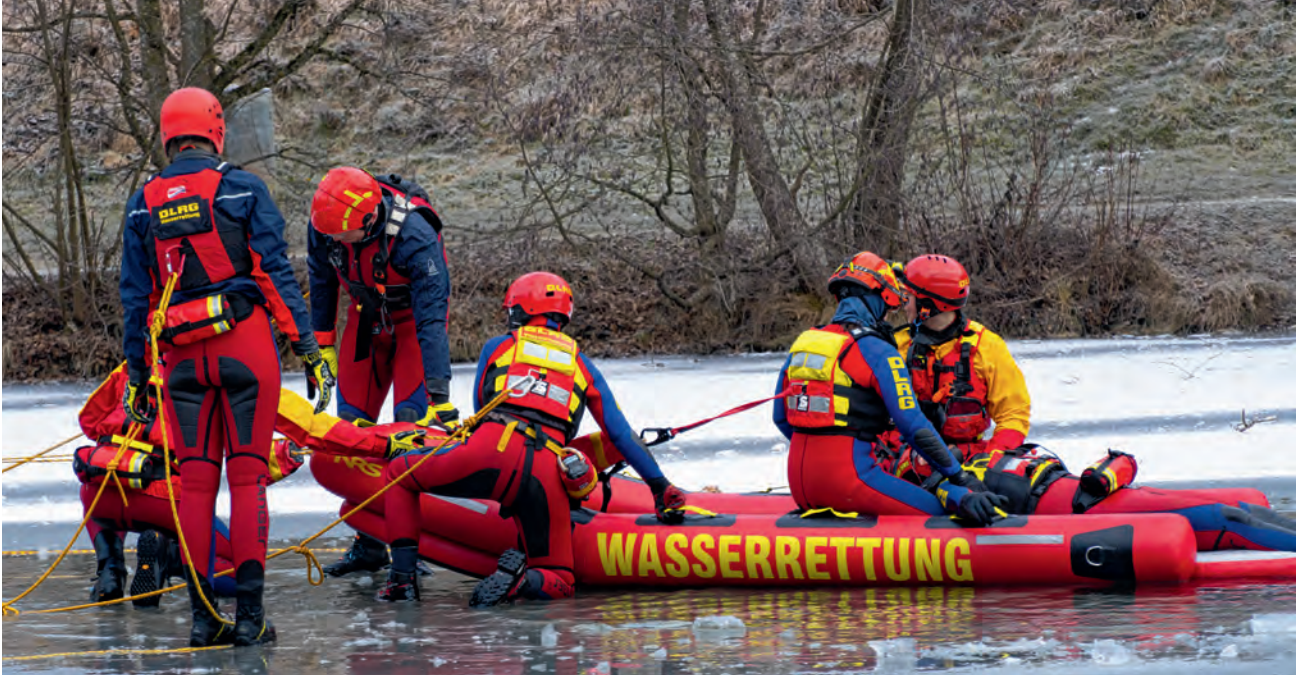
Eisrettungs- und Eistauchübung unter Beteiligung von 77 Einsatzkräften aus den Bezirken Esslingen, Rems-Murr, Fils, Glerns-Schönbuch und Reutlingen/Tübingen.