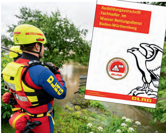
Zentraler Baustein: Die Ausbildungsvorschrift AV812BW.

Zur Vereinfachung der Nachweisführung stehen moderne Dokumentationsmöglichkeiten zur Verfügung. Fortbildungen können sowohl digital im DLRG-Manager als auch klassisch im Dienstbuch erfasst werden. Die Neuerungen schaffen Transparenz sowie Vergleichbarkeit und tragen zu einer hohen Qualität der Ausbildung im Katastrophenschutz bei. So entsteht eine verlässliche Grundlage für zukünftige Einsätze und Ausbildungen. Leonie Staudenmayer <