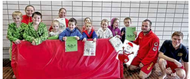
Im Herbst 2025 fanden bereits zwei Anfängerschwimmkurse mit jeweils zehn Teilnehmern statt.

Zum Abschluss der Kurse erhielten bereits einige Teilnehmer ihr Seepferdchen-Abzeichen als Zwischenzeugnis auf dem Weg zum sicheren Schwimmer. Kursleiterin Anna-Katharina Lachenmaier kündigte an, im Frühjahr 2026 weitere Anfängerkurse sowie Angebote für Fortgeschrittene zu organisieren: »Wir wollen das Ziel des sicheren Schwimmers verfolgen.«