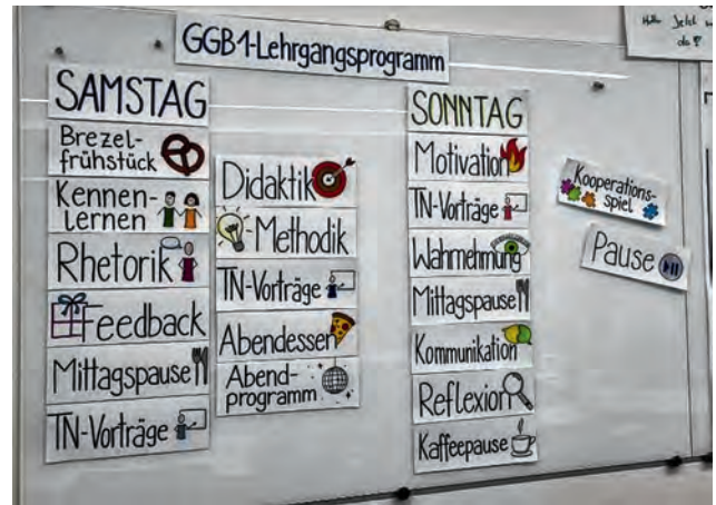
Das DLRG-Bildungswerk macht fit fürs Ehrenamt.

Das ist nicht immer einfach, denn die zeitlichen Ressourcen der ehrenamtlichen Lehrkräfte sind begrenzt. Neben der Arbeit im