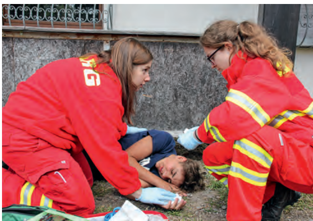
Für Rettungsschwimmer ist die Ausbildung in Erster Hilfe Pflicht.

I m Rahmen der Rettungsschwimmausbildung ist beispielsweise die Ausbildung in Erster Hilfe verpflichtend. Für ein dauerhaftes und qualitätsgesichertes Angebot auf Ebene der