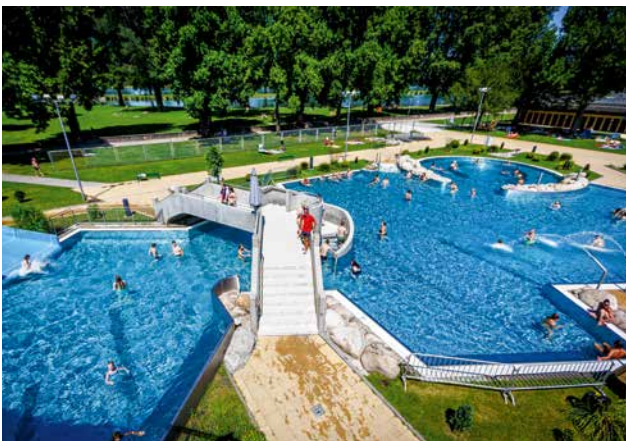
Das Rheinstrandbad in Rappenwört.

Karlsruhe steht unter erheblichem Sparzwang: Für den Doppelhaushalt 2026/27 sollen jährlich 80 Millionen Euro eingespart werden. Auch die Bäderbetriebe geraten dabei unter Druck – insbesondere das traditionsreiche Rheinstrandbad Rappenwört, dem zeitweise eine zweijährige Schließung drohte. Nun ist eine vorläufige Entscheidung gefallen: Das Bad bleibt geöffnet.